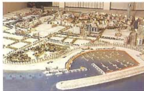
Maqueta del Puerto de Recreo

Estas columnas son piezas principales del camino romano y fueron halladas en la entrada de la Iglesia Maronita de San Jorge, en 1963.