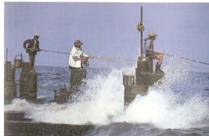
Pescadores en Beirut

Si bien Beirut es considerada como una ciudad milenaria, la mayoría de los descubrimientos arqueológicos fueron meras casualidades. En 1991, a fines de la guerra, hubo oportunidades inmejorables para la investigación de su pasado histórico a través de las excavaciones arqueológicas y las investigaciones científicas.