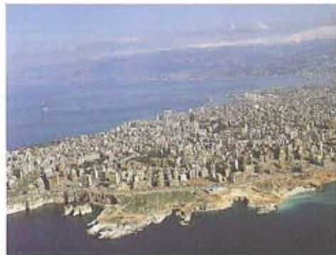
Vista General de Beirut

La capital libanesa cuenta con un número importante de periódicos y publicaciones en