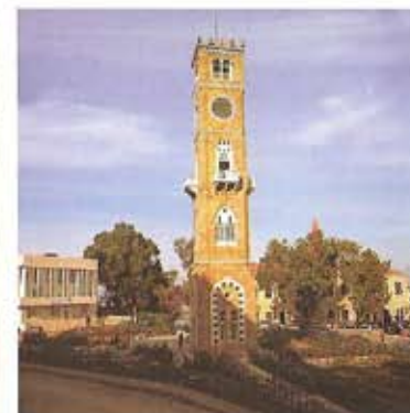
Torre del Reloj

podía observar una estructura enorme, la cual fue sujeta con pilares romanos.