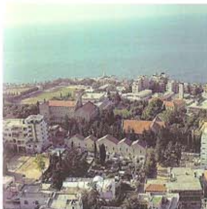
Vista General de la Calle Bliss y del Campus de la Universidad Americana de Beirut

idioma árabe, inglés, francés y armenio. Las cinco universidades con que cuenta Beirut contribuyen a impartir las distintas ramas de las ciencias e innovar la producción intelectual. El desarrollo de las artes, la cinematografía, la música y las artes plásticas consolidan el acervo cultural que permite experimentar un continuo avance de la ciudad. Entre sus condiciones naturales, la ciudad posibilita conformar el ámbito favorable para las convenciones y los congresos regionales e internacionales.