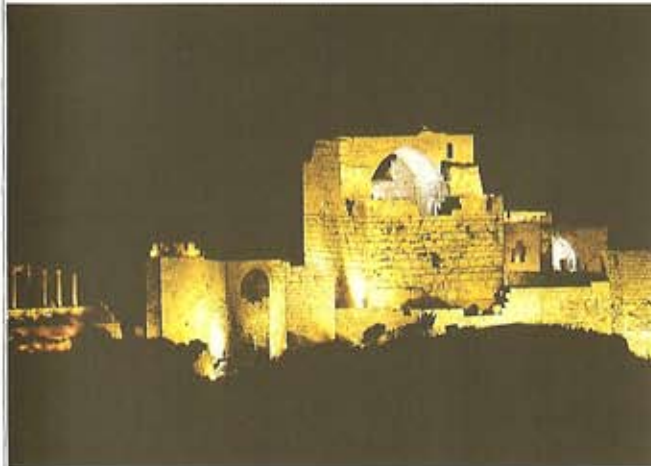
El Castillo de los Cruzados.

A mediados del siglo primero a.C., los romanos conquistaron las costas fenicias