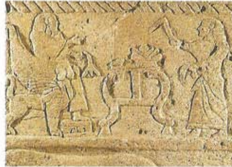
Detalle del sarcófago de Ahirom S. XVIII a.C. (Museo Nacional de Beirut).

Los griegos, 1.000 a.C., y después los romanos, denominaron a la costa meridional con el nombre de "Fenicia" y a la ciudad como "Biblos". Estas nuevas denominaciones guardan en su lengua original el significado de