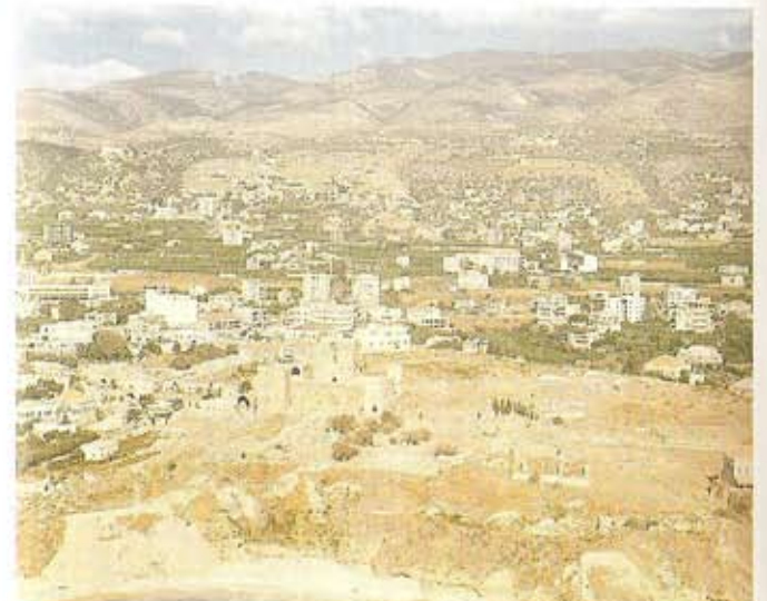
Vista general de la ciudad de Biblos.

Hacia fines del segundo milenio a.C., un grupo extranjero denominado "hombres del mar" se estableció sobre las costas meridionales del país de Canaan. Éstos allegados fueron los que impartieron los primeros conocimientos de las ciencias navales y la navegación entre los pueblos de la región, denominada más tarde Fenicia.