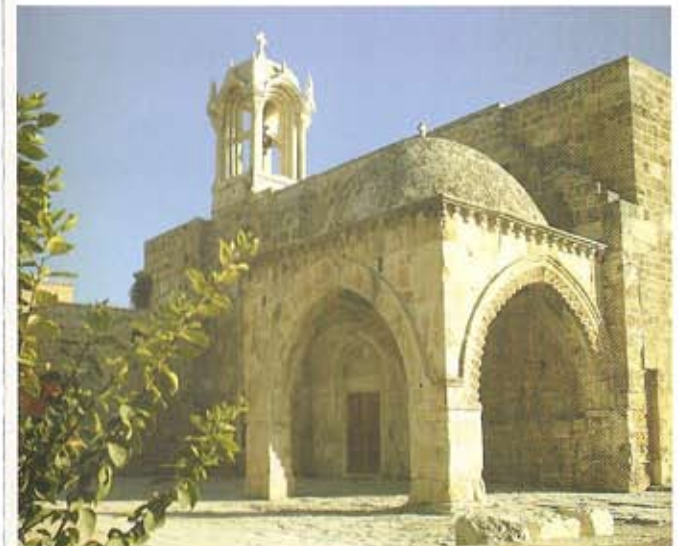
Bautismal e Iglesia de San Juan de los Cruzados

Con el correr del tiempo, los sedimentos acumulados en el sitio se transformaron en un terraplén de doce metros de altura sobre el cual fueron construidas mansiones y jardines. En 1860, el científico francés Ernest Renan visitó Biblos y realizó sendas excavaciones. Entre 1921 y 1924, a fines de la primera guerra mundial, el egiptólogo Pierre Montet descubrió el vínculo cultural que mantenía Biblos con Egipto. En 1925, el francés Maurice Dunand tomó a su cargo, por orden de la Dirección General de Arqueología Libanesa, el control de las excavaciones del sitio hasta 1975, y