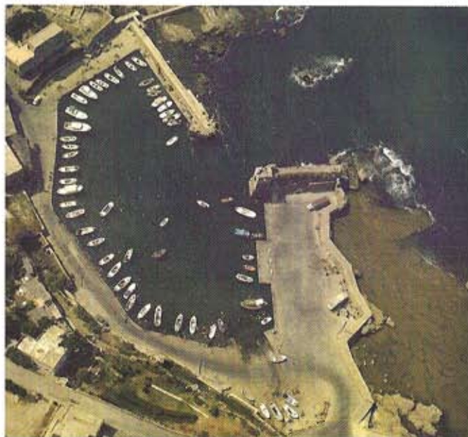
El puerto de Biblos

Una vez concluida la visita por los sitios más antiguos de la ciudad, no hay que olvidar de visitar el museo de cera donde se podrá contemplar la vida campestre libanesa.