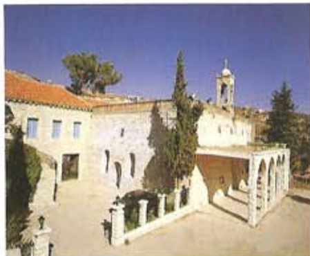
Monasterio San Elías at-Tuwak