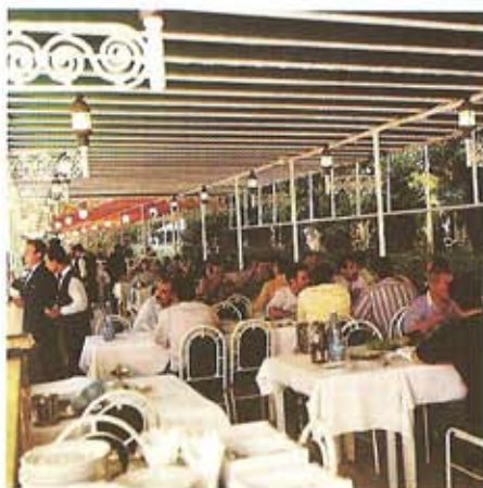
Restaurante en Bardawni

su acento particular. En cuanto a la reputación intelectual de la ciudad, responde a una larga alcurnia de poetas, pensadores y escritores que han contribuido al desarrollo cultural del Líbano, en su totalidad.