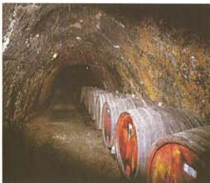
Bodegas de Ksara

En 1885, fue construido el Palacio Gubernamental, del período Otomano; construido en madera y sólidas rocas.