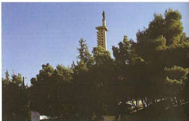
Nuestra Señora de Zahle y de la Bekaa

Hay muchos sitios arqueológicos en Zahle que se remontan a la Era de Bronce (3000-1200 a.C). Se pueden observar las cavernas entre las rocas de Wadi al-Arayech y los restos de tumbas en los alrededores de la ciudad.