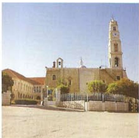
El monasterio de Nuestra Señora de Salvación (Saidet an-Nayat)